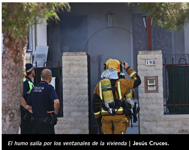
El humo salía por los ventanales de la vivienda

Por suerte la presencia en el momento del inicio del fuego de una patrulla de la Policía Nacional ha permitido el rápido desalojo de la zona y que no haya habido que lamentar heridos. El fuego ha calcinado por completo el garaje, en el que se encontraba además del vehículo, una motocicleta, así como varias máquinas de hacer ejercicio.