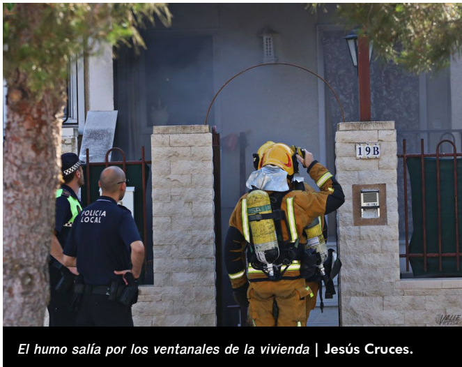
El humo salía por los ventanales de la vivienda | Jesús Cruces.

Por suerte la presencia en el momento del inicio del fuego de una patrulla de la Policía Nacional ha permitido el rápido desalojo de la zona y que no haya habido que lamentar heridos. El fuego ha calcinado por completo el garaje, en el que se encontraba además del vehículo, una motocicleta, así como varias máquinas de hacer ejercicio.