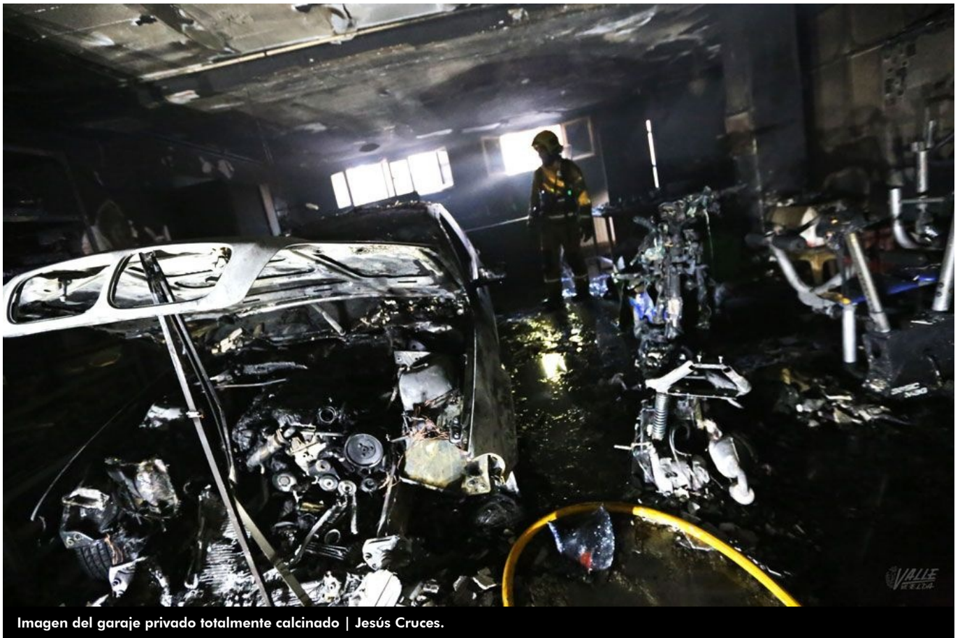
Imagen del garaje privado totalmente calcinado | Jesús Cruces.

El incendio espontáneo de un coche esta tarde ha calcinado por completo una plaza de garaje en la calle Costa Blanca de Petrer, en el barrio San José, paralela a la avenida del Mediterráneo. El habitáculo cerrado ha propiciado que las llamas se extendiesen con rapidez por todo el local y que el humo ocupara todo el espacio y saliera en grandes cantidades por la puerta del garaje comunitario, por las ventanas del mismo así como por la vivienda a la que está conectada este garaje privado, situado en la calle Riu Serpis. La rápida actuación de los Bomberos ha impedido que el fuego se propagase.