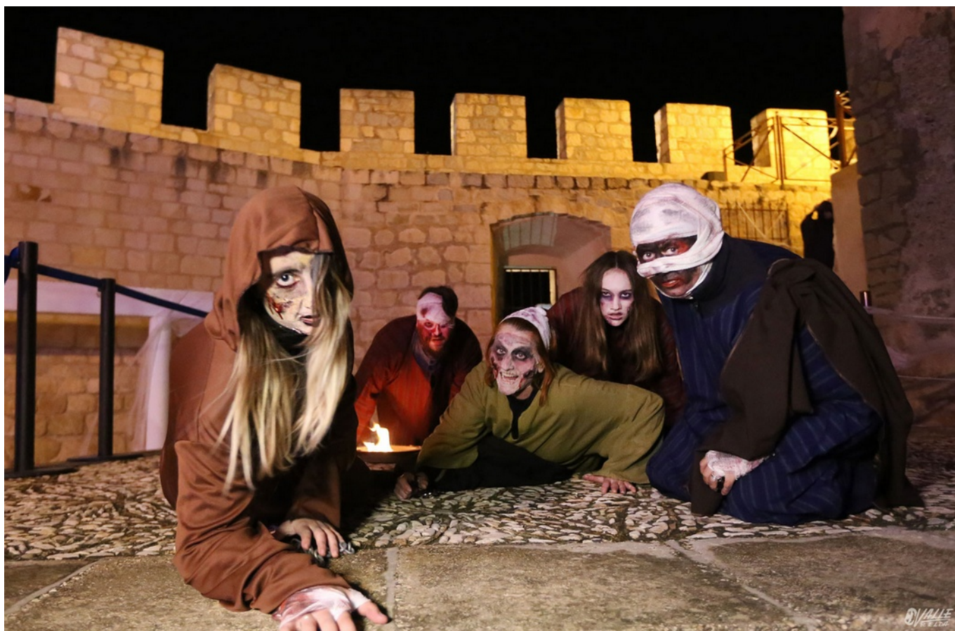
Los muertos vivos invadieron el castillo de Petrer