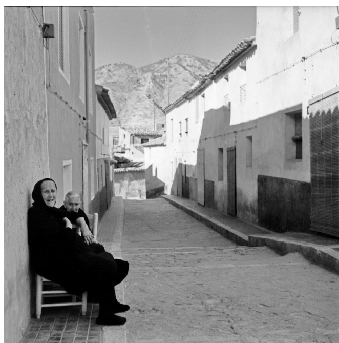
Las abuelas solían hacer ganchillo y randa, siendo una imagen típica del Petrer de hace unos años verlas realizando estas

Las abuelas en verano se sentaban a la puerta de su casa a hablar o hacer labores: ganchillo, randa (bolillos) y remiendos. En invierno se reunían junto a la chimenea y hacían rosas (palomitas), contaban cuentos a los niños, mientras los abuelos hacían cuerda (pleita) con esparto.