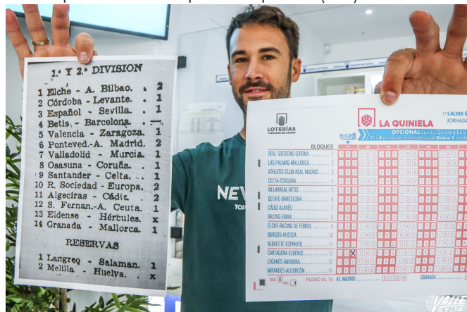
A la izquierda la quiniela del 26-4-1964 cuando jugó el Eldense por última vez en Segunda División

Por otro lado, el Deportivo se estrenó en la quiniela como equipo de Segunda División el 9 de septiembre de 1956 recibiendo en El Parque al Córdoba, conjunto al que goleó con claridad (4-0), mientras que el 26 de abril de 1964, día que abrió sus puertas el antiguo Estadio Municipal Pepico Amat, apareció por última vez como club de Segunda División frente al Hércules de Alicante, duelo que acabó en reparto de puntos (1-1).