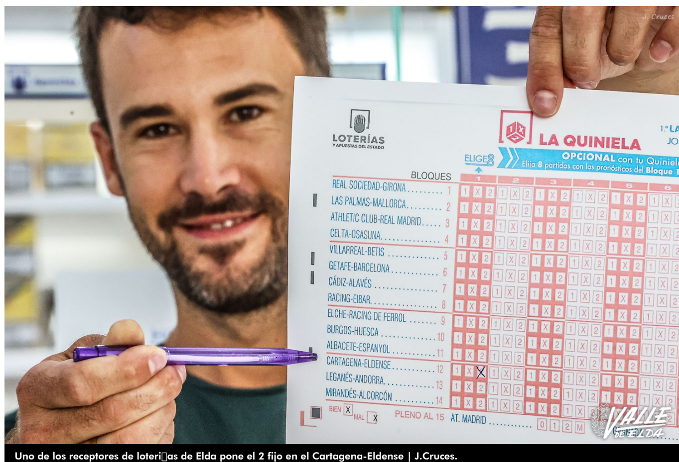
Uno de los receptores de loterías de Elda pone el 2 fijo en el Cartagena-Eldense | J.Cruces.

Después de casi 35 años, el popular boleto quinielístico se acuerda del Eldense, ya que la última vez que apareció el Deportivo en las apuestas del 1x2 fue el 13 de noviembre de 1988 cuando visitó al Hércules de Alicante (2-0) en partido de Liga de Segunda B.