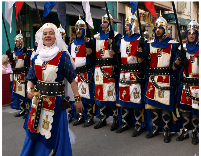
Traje femenino de los Cristianos.

Siguiendo la estela de la comparsa de Musulmanes, los Estudiantes también consiguieron crear un traje oficial destinado a la mujer festera. Esto ocurrió en el año 1999 y fue, esencialmente, un traje de estudiante adaptado a las características femeninas. En el transcurso de ese mismo año 1999, la comparsa de Cristianos cambió su traje oficial con características del siglo XVII por uno de corte medieval y, junto a éste, también se diseñó un traje femenino que, al menos en su versión de desfiles, no ha llegado a cuajar hasta la fecha.