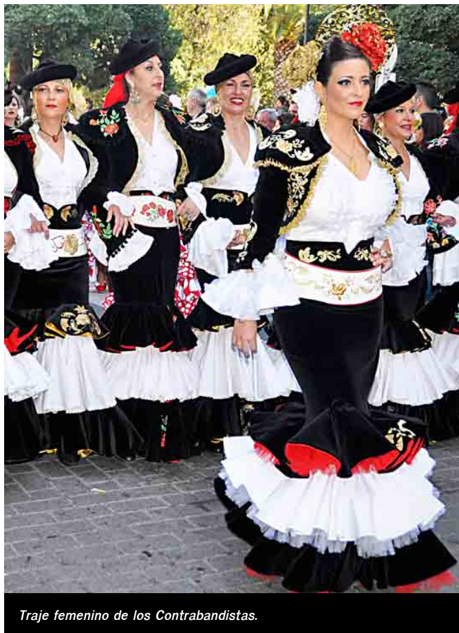
Traje femenino de los Contrabandistas.

Otras comparsas, como los Zingaros y Marroquies, ha decidido por ahora mantener el traje oficial unisex para todos sus festeros, ya que las mujeres de ambas formaciones prefieren, al parecer mayoritariamente, vestirse con el traje de hombre. Los Piratas, que cambiaron algunas prendas de su traje oficial hace algunos años, adaptaron éste a la idiosincrasia femenina de sus festeras con pequeños ajustes.