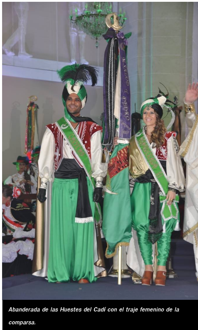
Abanderada de las Huestes del Cadí con el traje femenino de la comparsa.

Finalmente, este viernes 27 de octubre de 2017 la comparsa de Moros Musulmanes tiene previsto presentar y aprobar en asamblea un nuevo traje femenino con la intención de hacerlo más asequible y atractivo a sus festeras que el actual oficial, que está en candelero desde hace veinte años.