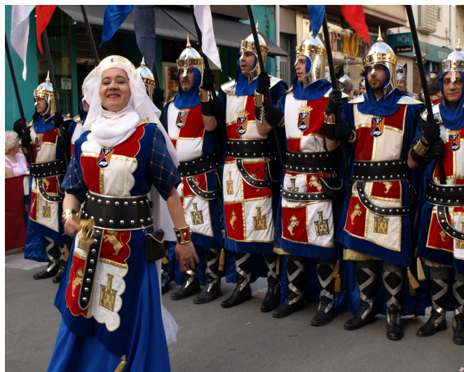
Traje femenino de los Cristianos.

Siguiendo la estela de la comparsa de Musulmanes, los Estudiantes también consiguieron crear un traje oficial destinado a la mujer festera. Esto ocurrió en el año 1999 y fue, esencialmente, un traje de estudiante adaptado a las características femeninas. En el transcurso de ese mismo año 1999, la comparsa de Cristianos cambió su traje oficial con características del siglo XVII por uno de corte medieval y, junto a éste, también se diseñó un traje femenino que, al menos en su versión de desfiles, no ha llegado a cuajar hasta la fecha.