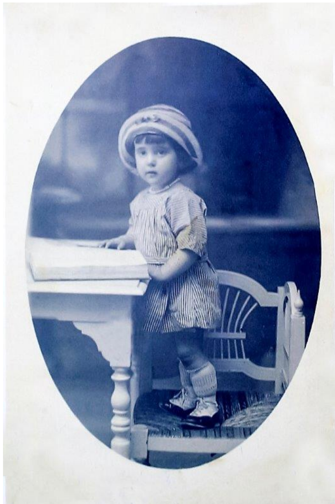
A esta niña le esperaba una vida llena de peripecias.