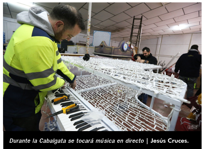
Durante la Cabalgata se tocará música en directo | Jesús Cruces.

Será un gran despliegue que permitirá a los niños disfrutar de esta noche especial y única, la que esperan con ganas durante todo el año.