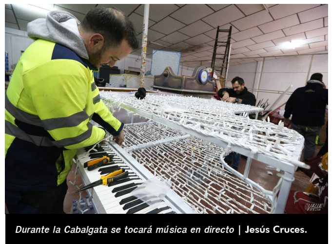
Durante la Cabalgata se tocará música en directo | Jesús Cruces.

Será un gran despliegue que permitirá a los niños disfrutar de esta noche especial y única, la que esperan con ganas durante todo el año.