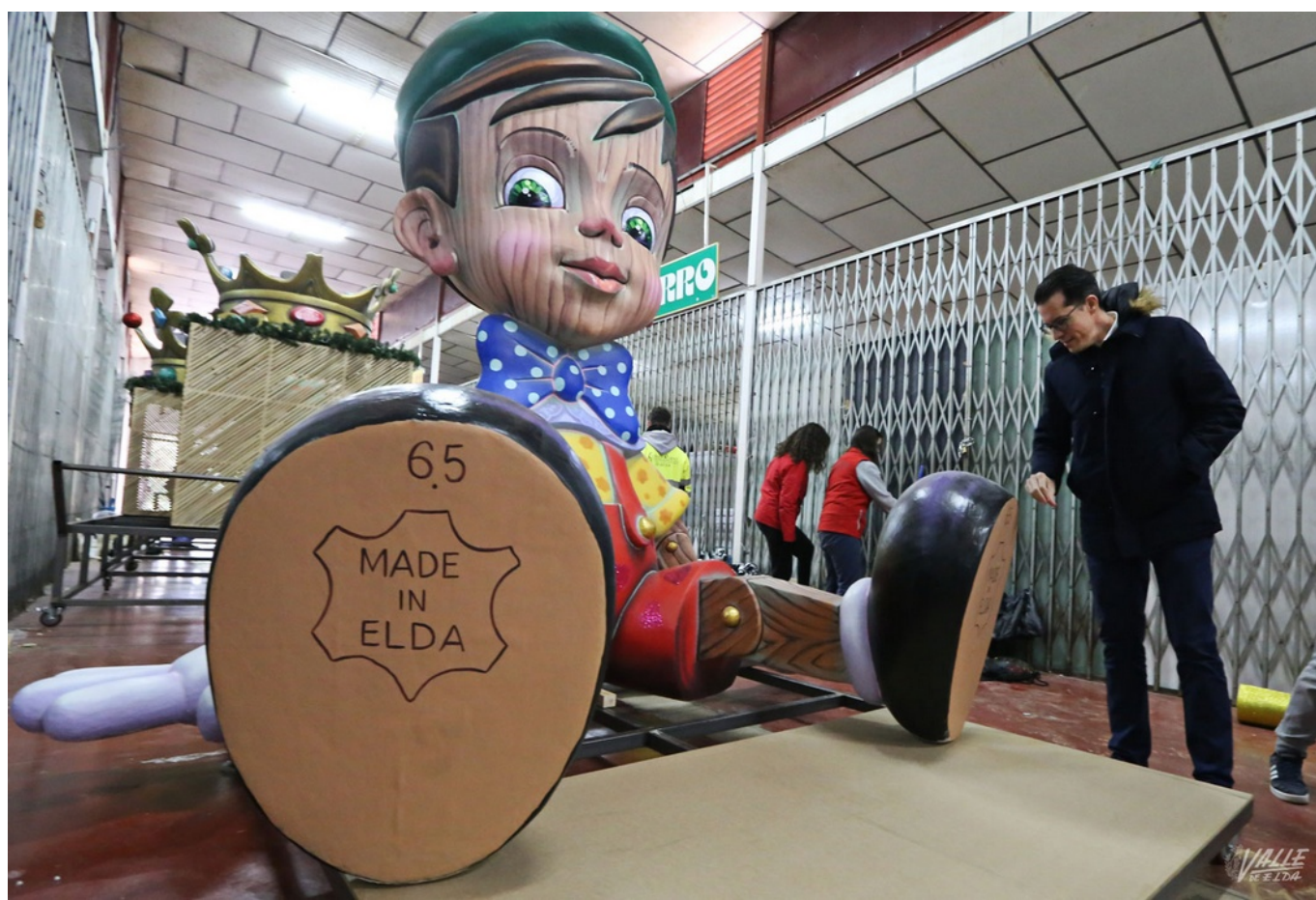
Ahora se están ultimando los trabajos para la Cabalgata