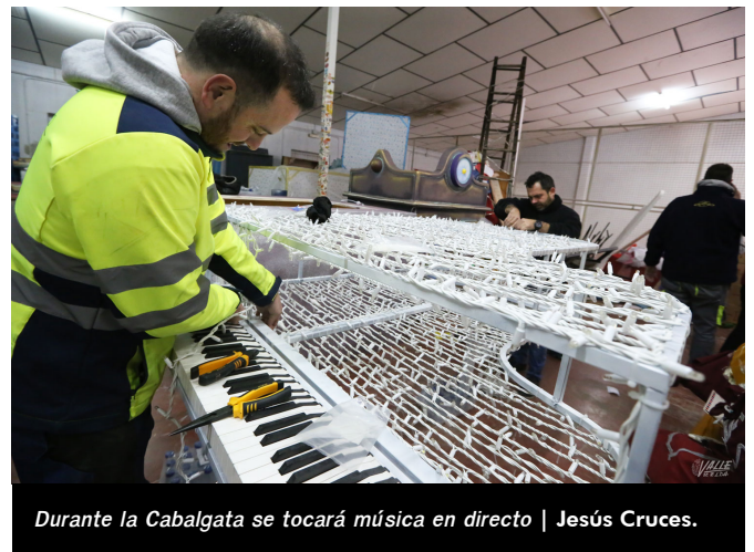
Durante la Cabalgata se tocará música en directo | Jesús Cruces.

Será un gran despliegue que permitirá a los niños disfrutar de esta noche especial y única, la que esperan con ganas durante todo el año.