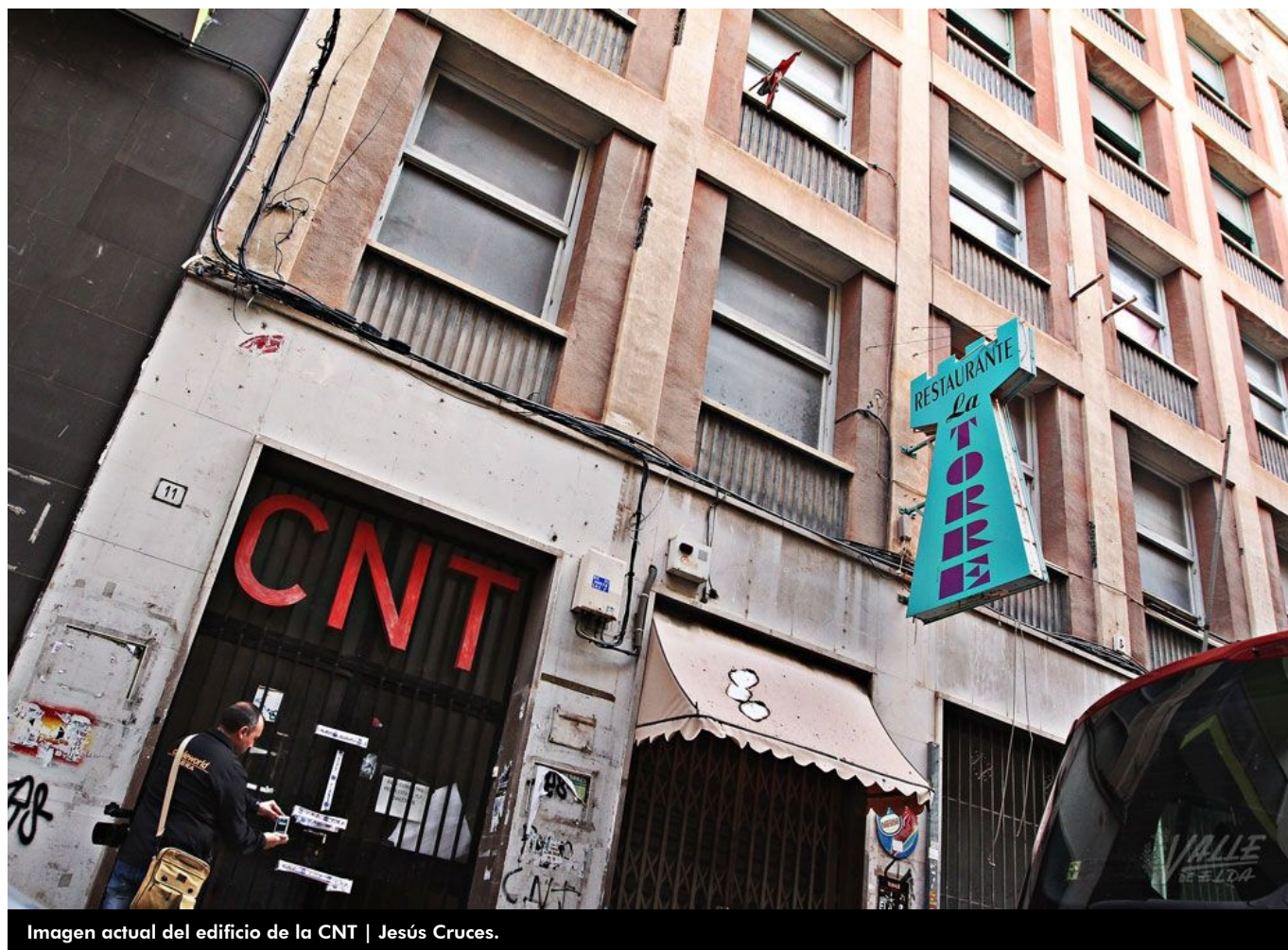
Imagen actual del edificio de la CNT | Jesús Cruces.

Hace 58 años, un 15 de mayo de 1960 , dieron inicio las obras de construcción de la Casa Sindical. En el entonces número 11 de la calle Menéndez Pelayo (act. nº 13), y sin ceremonia oficial alguna de colocación de la primera piedra, se empezó a construir un edificio que albergaría todas las dependencias sindicales que hasta el momento funcionaba de forma dispersa por toda la ciudad, en lugares en ocasiones sin las condiciones debidas.