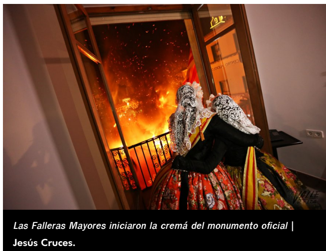
Las Falleras Mayores iniciaron la cremá del monumento oficial