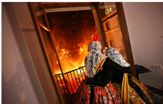
Las Falleras Mayores iniciaron la cremá del monumento oficial