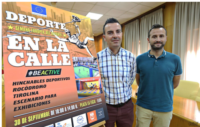
Gómez y Martínez han presentado esta actividad | Jesús Cruces.