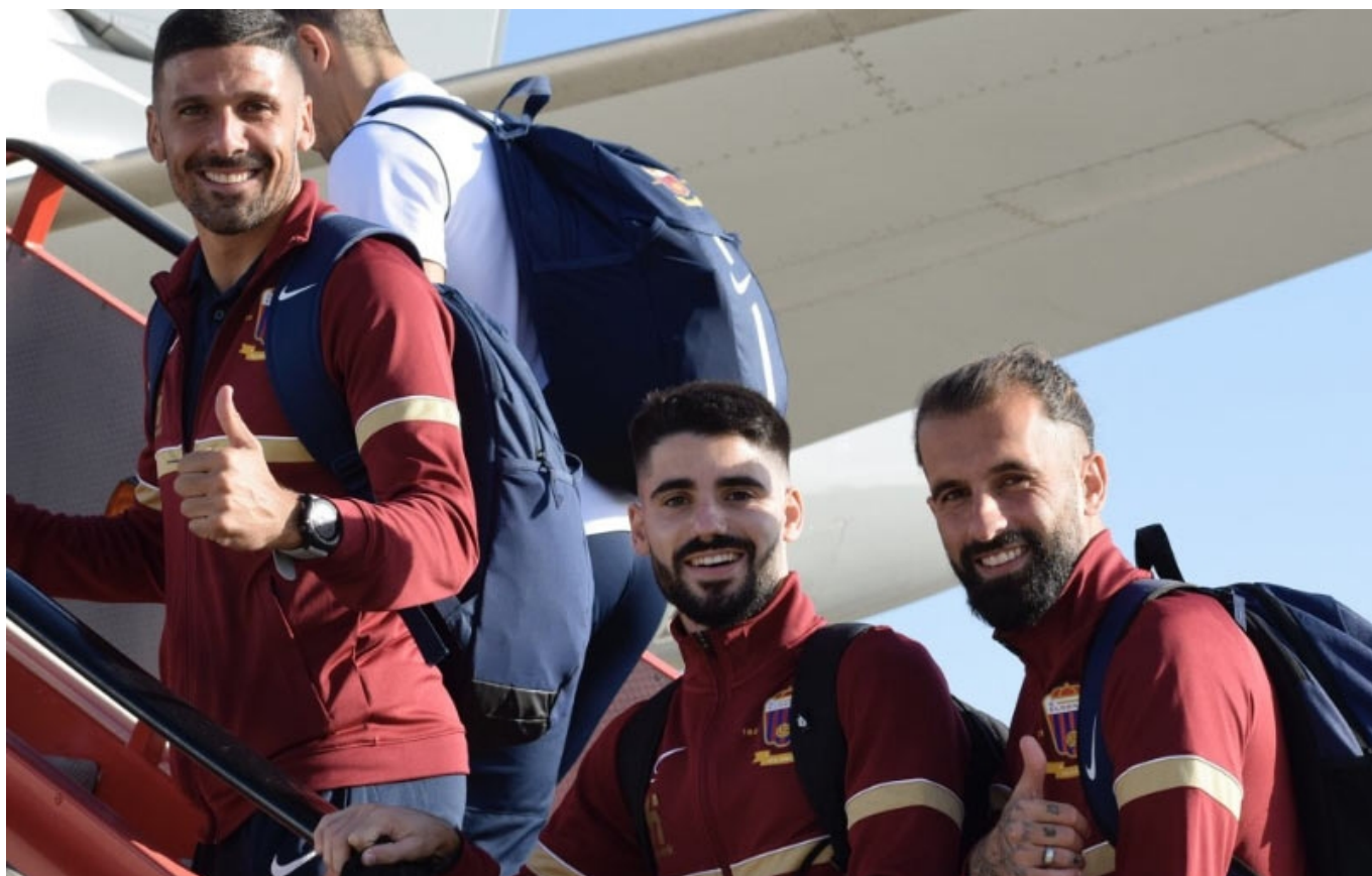
Los jugadores del Eldense volverán a subir al avión para jugar en Barcelona | Sergio Navarro.

El Eldense ya se parece a un equipo profesional. El equipo azulgrana viaja en avión mañana miércoles para jugar ese día (21 horas) contra el Barcelona Atlètic en el Estadi Johan Cruyff, pernoctar en la capital barcelonesa para entrenar el jueves, en sesión matinal, en la Ciudad Deportiva Joan Gamper antes de comer y regresar de nuevo por vía aérea.