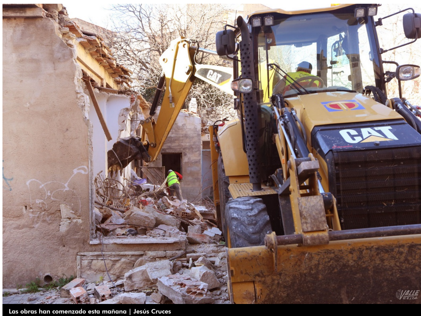
Las obras han comenzado esta mañana