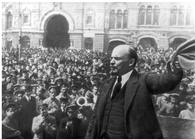
El autor sostiene que la revolución rusa de 1917 condicionó el devenir de todo el siglo XX.

Desde aquí, Fontana mostrará que fascismo y nazismo supusieron las respuestas contundentes a la amenaza comunista, en tanto que la época dorada de la sociedad del bienestar socialdemócrata (1945-75) se implantó como antídoto a la amenaza del comunismo tras la debacle económica del capitalismo en 1929 y la devastación de la II Guerra Mundial. La tendencia vira en los años setenta con el apogeo neoliberal y el hundimiento del poder soviético hasta la caída del muro de Berlín en 1989, que dará paso a una etapa de crisis sucesivas y un retroceso de las conquistas anteriores con altísimos niveles de desigualdad y pobreza, inimaginables hace cincuenta años.