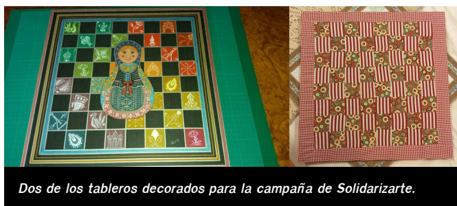
Dos de los tableros decorados para la campaña de Solidarizarte.

El 4 de abril del año 782, en el palacio oriental de Aquisgrán se celebró una fiesta extraordinaria para conmemorar el cuadragésimo cumpleaños del gran monarca Carlomagno. (...)