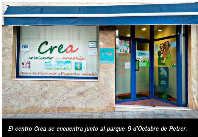
El centro Crea se encuentra junto al parque 9 d'Octubre de Petrer.