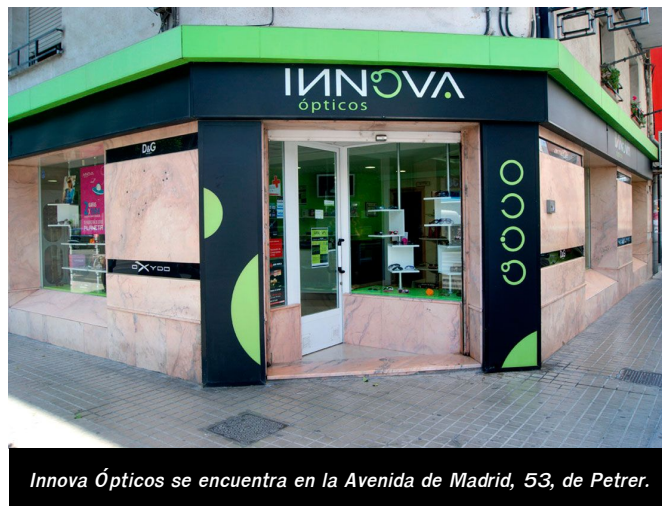
Innova Ópticos se encuentra en la Avenida de Madrid, 53, de Petrer.

Innova Ópticos busca la mejor solución a tus carencias visuales