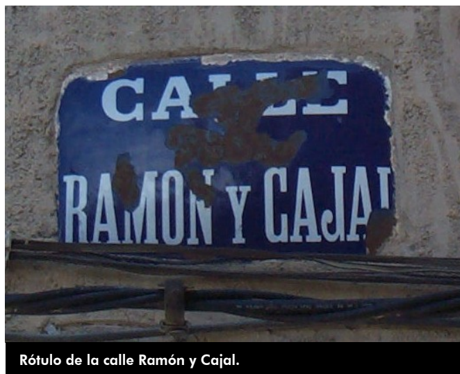
Rótulo de la calle Ramón y Cajal.

Aquella decisión de hoy hace 108 años , fue el inicio de un rosario de agresiones y “atentados” contra nuestro patrimonio, de mayor o menor tamaño, de mayor o menor envergadura, que perpetrado desde instancias oficiales abrió las puertas a la agresión a gran escala que durante décadas sufrió el patrimonio histórico y cultural de nuestra ciudad.