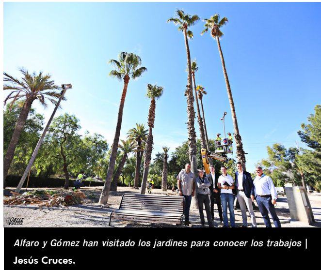
Alfaro y Gómez han visitado los jardines para conocer los trabajos

Fobesa ha sido la empresa que mejor precio a la baja ofreció por este contrato de tres meses de duración, un total de 51.000 euros , por lo que la concejalía dispone ahora de crédito para continuar con la limpieza de jardines en otras zonas de la población . La empresa está empleando a seis trabajadores a tiempo completo además de aportar toda la herramienta, vehículos y maquinaria para desempeñar esta labor.