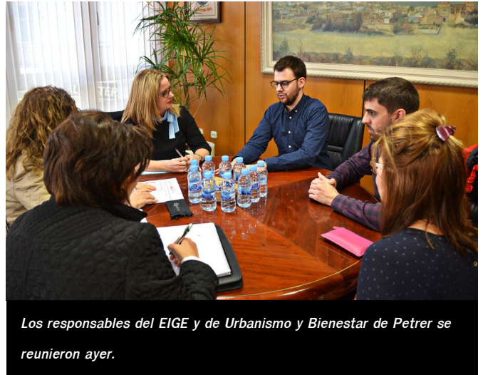
Los responsables del EIGE y de Urbanismo y Bienestar de Petrer se reunieron ayer.

Fruto de estas reuniones, 24 inquilinos ya se han beneficiado de las bonificaciones que aplica la Generalitat para abaratar su alquiler , priorizando según sus ingresos y el número de miembros de la familia. Otros 11 han firmado actas de reconocimiento de deuda para hacer frente a los impagos, ajustándose a sus circunstancias socioeconómicas.