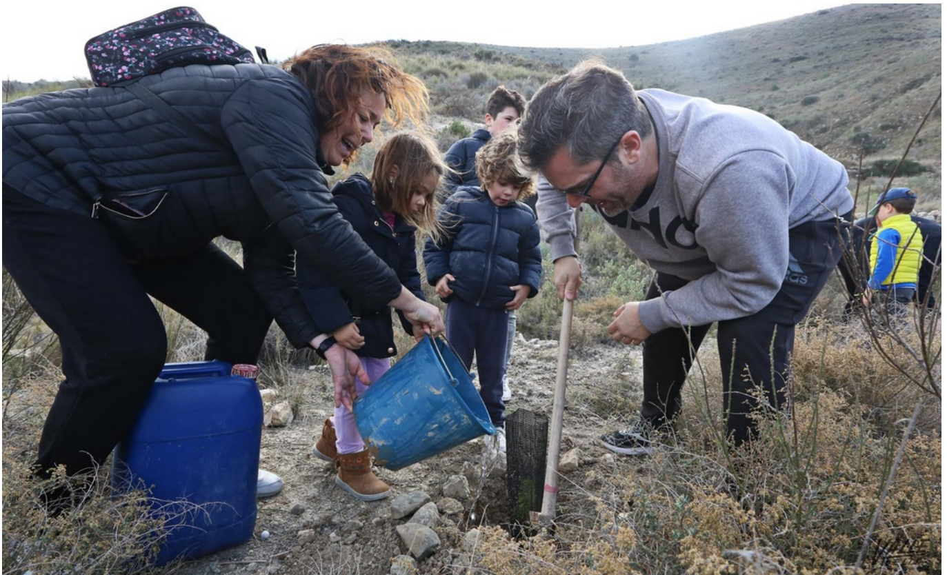
Decenas de familias han acudido al monte Bolón para su reforestación | Jesús Cruces

Alrededor de 200 eldenses han celebrado un año más el Día del Árbol , que por segundo año se ha materializado con la reforestación de la umbría de Bolón , organizada por la Concejalía de Medio Ambiente de Elda . A pesar del día ventoso, decenas de familias y amigos han pasado la mañana en la naturaleza, donde han plantado un total de 300 árboles y arbustos como pino carrasco, romero, efedra y lentisco , cuatro tipos de especies autóctonas para que el monte luzca más verde.