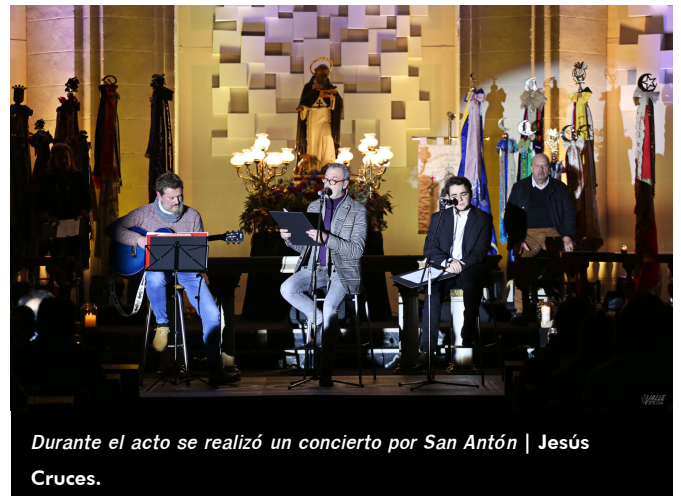
Durante el acto se realizó un concierto por San Antón.

La imagen permanecerá en la parroquia de Santa Ana hasta el próximo sábado 26 de enero, cuando a las 18 horas tendrá lugar el Traslado de San Antón hacia su ermita en un acto que contará con los cargos de 2019 así como autoridades festeras y civiles. Pero antes, el viernes a las 20:30 horas también en la iglesia tendrá lugar un encuentro de tres generaciones (niños, adultos y mayores) bajo el título Pasado, presente y futuro con San Antón , que organiza la Mayordomía para que los más pequeños conozcan al santo y para homenajear la labor de cada generación en pro de la fiesta.