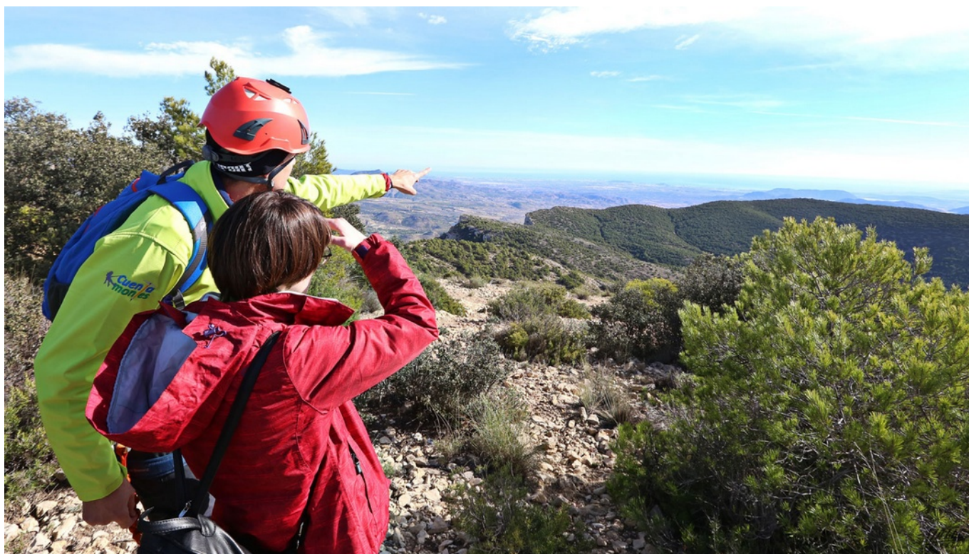
La ruta recorrerá los principales parajes de Petrer.

El ultra maratón ElCid Falcoxtrem, que organiza el Centro Excursionista de Petrer en colaboración con el Ayuntamiento, la Diputación de Alicante y empresas y entidades deportivas de montañismo, se celebrará mañana 25 de enero y transitará por un trazado de 70 kilómetros y 3.300 metros de desnivel, por parajes de tres términos municipales: Petrer y Castalla en su mayoría y Tibi (1% de la misma), con el reto de completar la prueba en un máximo de 20 horas.