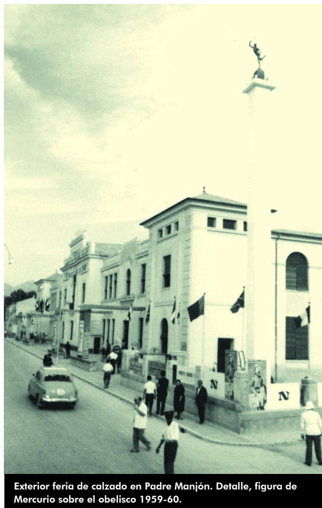
Exterior feria de calzado en Padre Manjón. Detalle, figura de Mercurio sobre el obelisco 1959-60.

generó para todos los pueblos zapateros de España. Desde entonces, una nueva estatua de Mercurio surca el cielo eldense, cual protector de la industria y el comercio e intentando atraer los buenos augurios para nuestra ciudad.