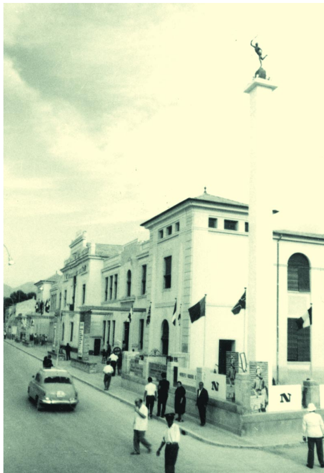
Exterior feria de calzado en Padre Manjón. Detalle, figura de Mercurio sobre el obelisco 1959-60.

generó para todos los pueblos zapateros de España. Desde entonces, una nueva estatua de Mercurio surca el cielo eldense, cual protector de la industria y el comercio e intentando atraer los buenos augurios para nuestra ciudad.