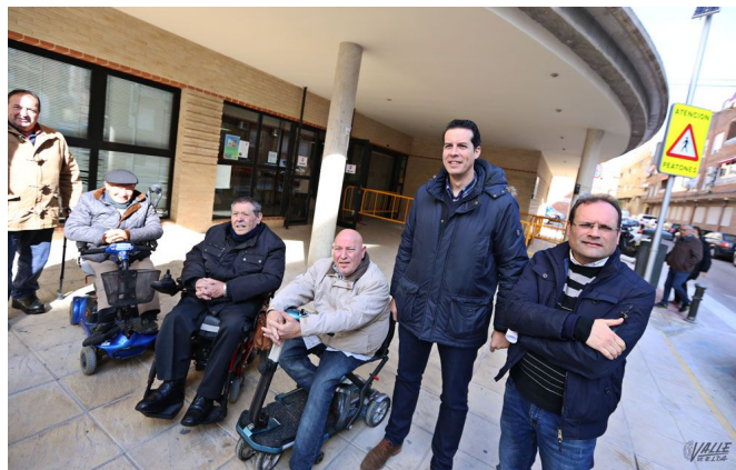
El Ayuntamiento ha dado respuesta así a una demanda de AMFI | Jesús Cruces.

indicado que continuarán con este programa de mejora, por lo que próximamente realizarán los rebajes de aceras en la calle Gregorio Marañón y la zona de la Torreja , "la idea es diseñar una ruta marcada por AMFI sin barreras arquitectónicas para que las personas con movilidad reducida o disminuidos físicos puedan recorrer de norte a sur toda la ciudad", ha dicho.