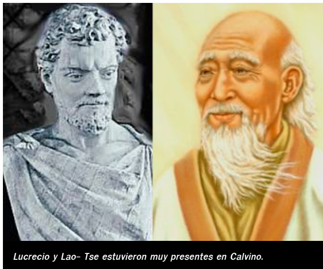
Lucrecio y Lao- Tse estuvieron muy presentes en Calvino.

Visto así, ¿quién sustenta a estos relámpagos fulgurantes que son los aforismos? Otros doce de la serie A vista de jibaro :