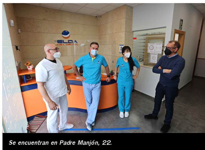
Se encuentran en Padre Manjón, 22.

Se encuentran en Gran Avenida, 2, de Elda, su teléfono es el 965 38 01 12 y disponen de página web https://clincaslineadental.com/ .