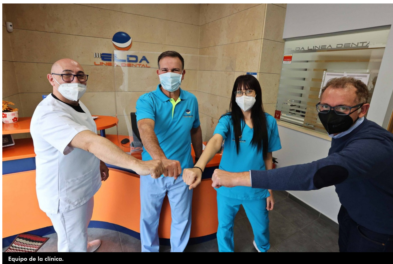
Equipo de la clínica.

Línea Dental abrió en el año 2009, y en estos doce años han demostrado una gran profesionalidad e implicación para dar solución a cada uno de sus pacientes, que son quienes avalan su trayectoria como clínica dental referente en Elda.