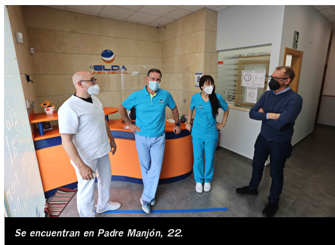
Se encuentran en Padre Manjón, 22.

Se encuentran en Gran Avenida, 2, de Elda, su teléfono es el 965 38 01 12 y disponen de página web https://clincaslineadental.com/ .