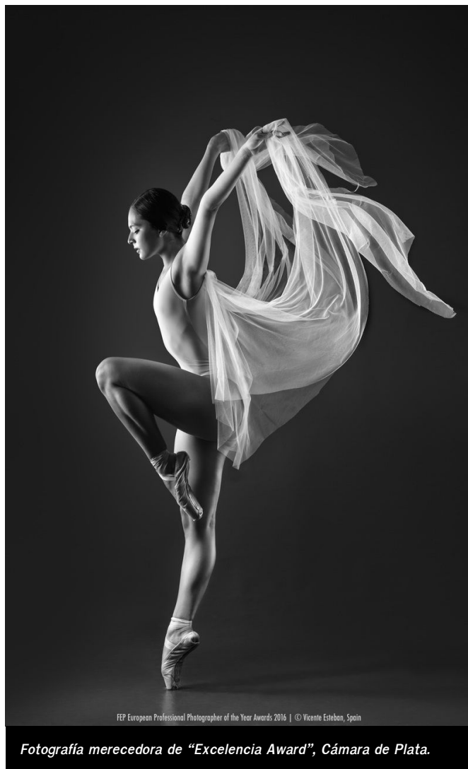
Fotografía merecedora de "Excelencia Award", Cámara de Plata.