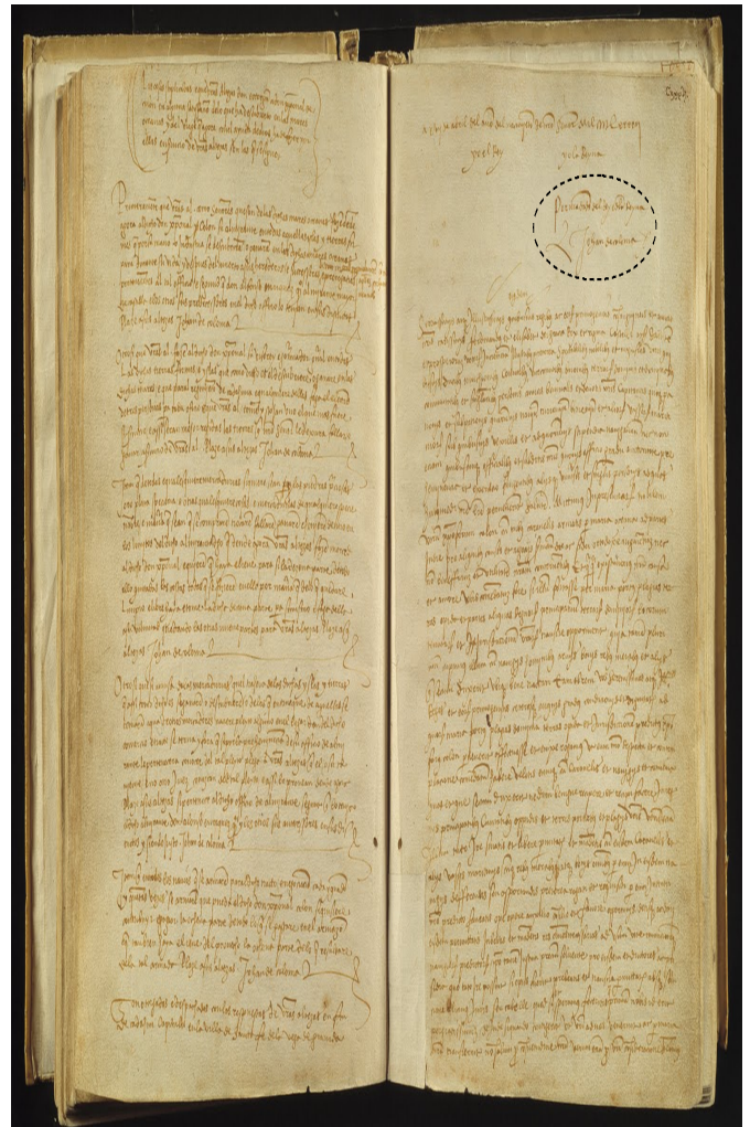
Capitulaciones de Santa Fe firmadas entre los Reyes Católicos y Cristóbal Colón e 17 de abril de 1492. Documento donde se recoge los acuerdos alcanzados con Cristóbal Colón relativos a la expedición hacia Occidente y en el que se puede apreciar la firma del secretario real Johan de Coloma.

Este cargo le permitió intervenir en los principales asuntos tanto de la corona aragonesa, caso del restablecimiento del Santo Oficio de la Inquisición en Aragón (1485) o actuar en nombre del rey de Aragón en el tratado de Barcelona (1493) por el cual Francia devolvía a condados catalanes del Rosellón y la Cerdaña (1493); así como en la corona de Castilla, pudiendo encontrar su presencia activa, junto a su mano redactora en documentos tan excepcionales de la historia de España como el edicto de Granada (1492) por el que se expulsaba a los judíos de todos los reinos de la Monarquía Hispánica o las mismísimas capitulaciones de Santa Fe (1492) entre los Reyes Católicos y Cristóbal Colón que permitieron el primer viaje colombino a las Indias y el descubrimiento de América.