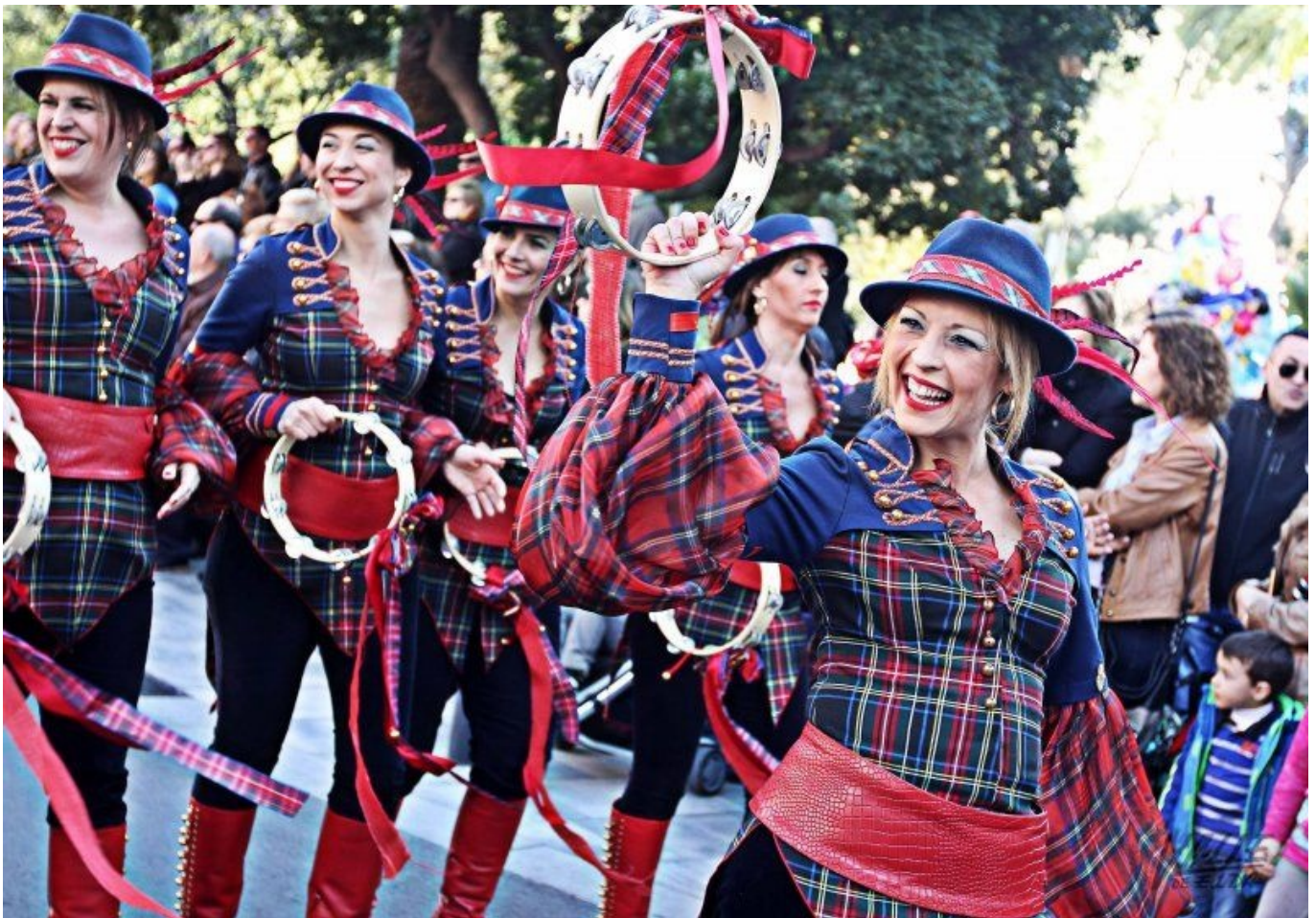
Los festeros ha vuelto a llenar de alegría las calles de Elda | Jesús Cruces.

El altar de Santa Ana se ha convertido esta mañana en el escenario de la Proclamación de los Capitanes y Abanderadas de los Moros y Cristianos de 2016. La Junta Central de Comparsas ha vuelto a sorprender a cientos de eldenses con un espectáculo cargado de sentimientos festeros. Los cargos salientes se han despedido con nostalgia de un año inolvidable al poner las bandas y entregar las banderas a los cargos entrantes que derrochaban alegría e ilusión.