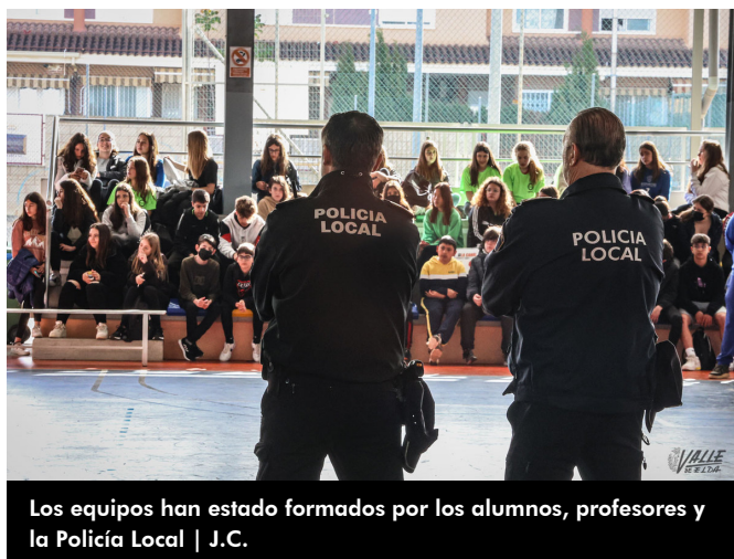
Los equipos han estado formados por los alumnos, profesores y la Policía Local

Antes de iniciar el campeonato, Navarro ha hecho el saque de honor , dando paso al primer partido entre el Colegio Santo Domingo Savio y el IES La Canal. Además, los diferentes institutos han realizado pancartas con mensajes contra el acoso escolar que se han colgado a lo largo del pabellón.