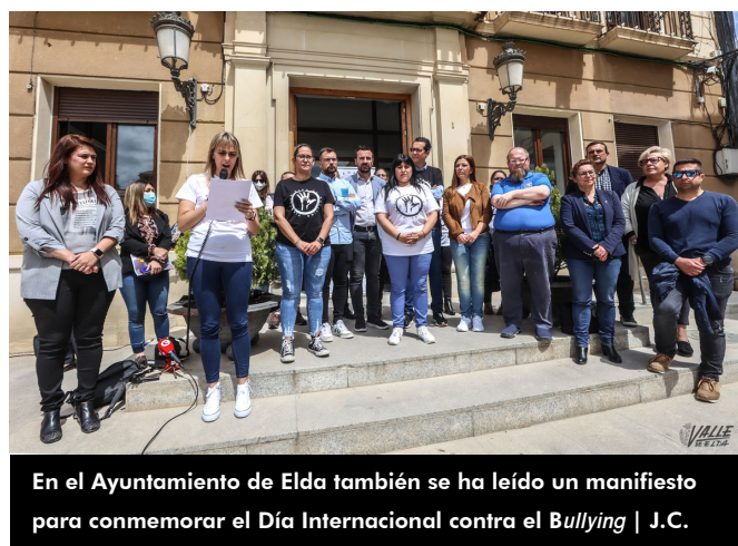
En el Ayuntamiento de Elda también se ha leído un manifiesto para conmemorar el Día Internacional contra el Bullying

Ayuntamiento de Elda se ha leído otro manifiesto junto a la plataforma "Plántale cara al bullying ". Al igual que en Petrer se ha tratado el tema del ciberacoso , puesto que "pasó de un 7 a un 16% en tal solo un año , lo que es un dato muy alarmante", ha explicado una de las componentes de la plataforma. En cuanto a la Comunidad Valenciana, se ha indicado que "la última memoria anual publicada sobre convivencia en las aulas en el 2016-2017 cifra una media de tres acosos al día en las escuelas de la comunidad, y eso teniendo en cuenta los datos oficiales ya que los reales la mayoría se silencian y son muchos más. La más frecuente de la violencias registradas suele ser la verbal con un 64% de los casos , seguida de la violencia física que es menos frecuente". Durante el manifiesto se ha querido recordar a las personas que han perdido su vida debido al acoso escolar, y también cómo a pesar de haber dado grandes pasos hacia delante, hay que seguir actuando porque "día tras día, sin saberlo, hay familias que mandan a sus hijos a una zona en la que no se sienten protegidos porque nadie se ha percatado de su situación ya que lo viven en silencio. Poco a poco su carácter cambia y su alegría desaparece".