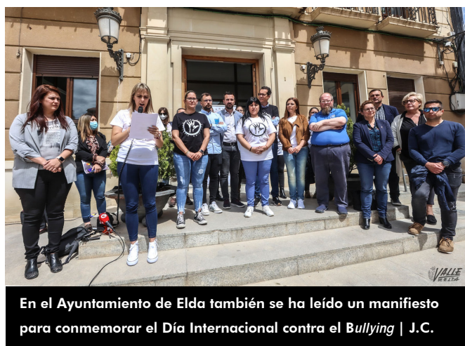
En el Ayuntamiento de Elda también se ha leído un manifiesto para conmemorar el Día Internacional contra el Bullying

Ayuntamiento de Elda se ha leído otro manifiesto junto a la plataforma "Plántale cara al bullying ". Al igual que en Petrer se ha tratado el tema del ciberacoso , puesto que "pasó de un 7 a un 16% en tal solo un año , lo que es un dato muy alarmante", ha explicado una de las componentes de la plataforma. En cuanto a la Comunidad Valenciana, se ha indicado que "la última memoria anual publicada sobre convivencia en las aulas en el 2016-2017 cifra una media de tres acosos al día en las escuelas de la comunidad, y eso teniendo en cuenta los datos oficiales ya que los reales la mayoría se silencian y son muchos más. La más frecuente de la violencias registradas suele ser la verbal con un 64% de los casos , seguida de la violencia física que es menos frecuente". Durante el manifiesto se ha querido recordar a las personas que han perdido su vida debido al acoso escolar, y también cómo a pesar de haber dado grandes pasos hacia delante, hay que seguir actuando porque "día tras día, sin saberlo, hay familias que mandan a sus hijos a una zona en la que no se sienten protegidos porque nadie se ha percatado de su situación ya que lo viven en silencio. Poco a poco su carácter cambia y su alegría desaparece".