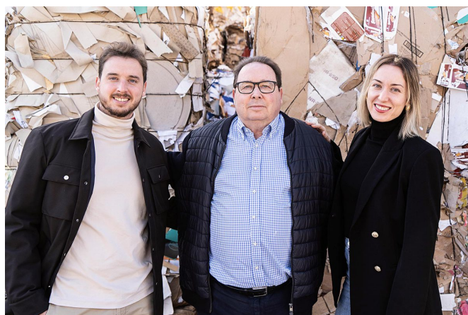
Esta es una empresa familiar.

Se encuentran en el polígono industrial Campo Alto, en la calle Alemania, número 120, de Elda. Su teléfono es el 965 395 521.