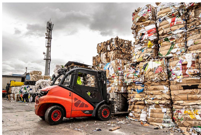
Reciclajes Elda cuida el medioambiente.

Reciclajes Elda apuesta por la innovación e inversión en sus instalaciones y equipos, con el fin de ofrecer a sus clientes, actuales y futuros, una gestión y valorización de sus residuos eficiente y actualizada, pudiendo así, cerrar la gestión completa del residuo, conocida como la regla de las tres erres (Reducir, Recuperar y Reciclar). El proceso comprende desde la primera visita del comercial para valorar el trabajo, hasta la retirada y gestión interna de los residuos, certificando dicha gestión para la eliminación y destrucción de materiales confidenciales o para la retirada y valorización de residuos que tienen vida útil.