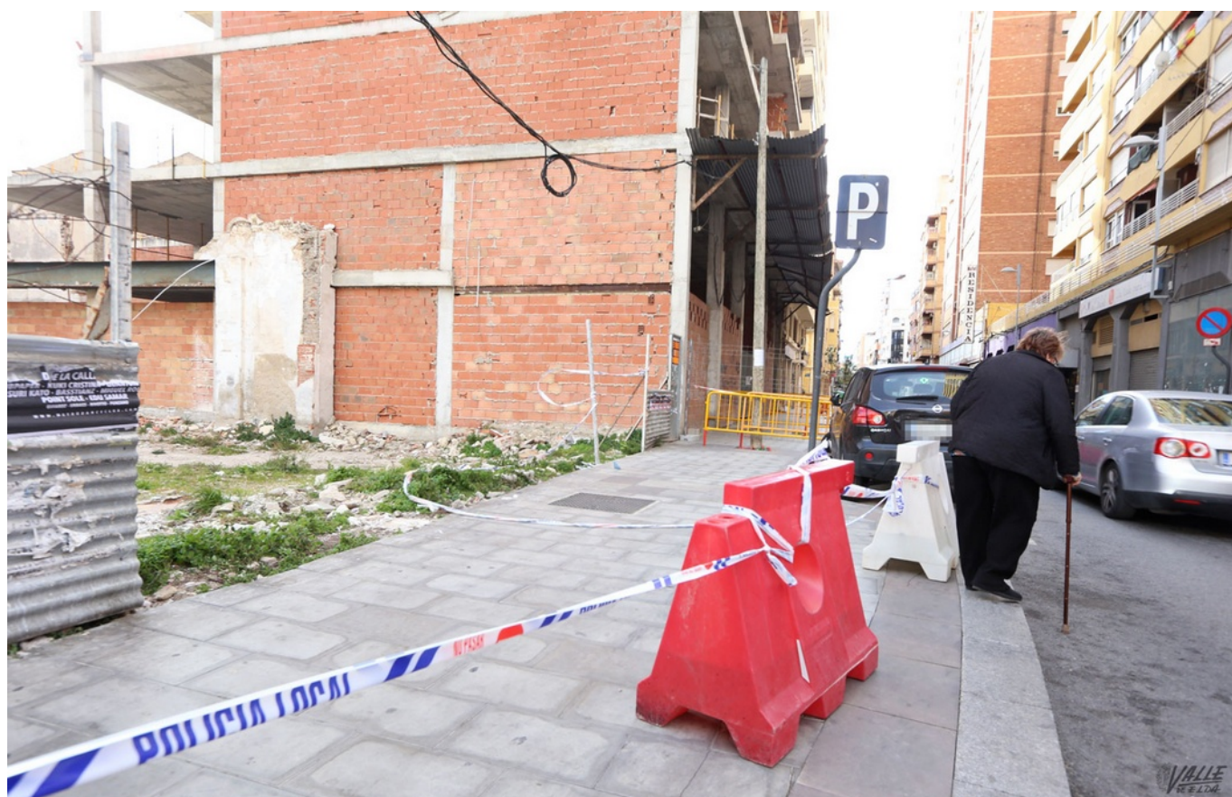
La acera de la primera manzana de la avenida de Chapí se ha cortado más

Las fuertes rachas de viento que se han registrado en Elda durante las últimas 24 horas han provocado que los bomberos hayan tenido que realizar diversas actuaciones para retirar chapas y toldos desprendidos, así como algunas vallas de protección que se habían soltado. Destacan los desperfectos causados por el aire en el solar número 7 de la avenida de Chapí, en la conocida como esquina del guardia, donde gran parte las chapas que lo cierran se retiraron durante la tarde de ayer y la Policía Local por seguridad amplió el corte de la acera en unos diez metros más.