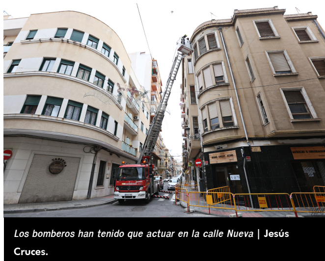
Los bomberos han tenido que actuar en la calle Nueva | Jesús Cruces.

Desde el Parque Comarcal de Bomberos han indicado que hoy el aire tiene menor intensidad que anoche , pero que esta mañana está siendo ajetreada puesto que les entran llamadas por desperfectos causados anoche.