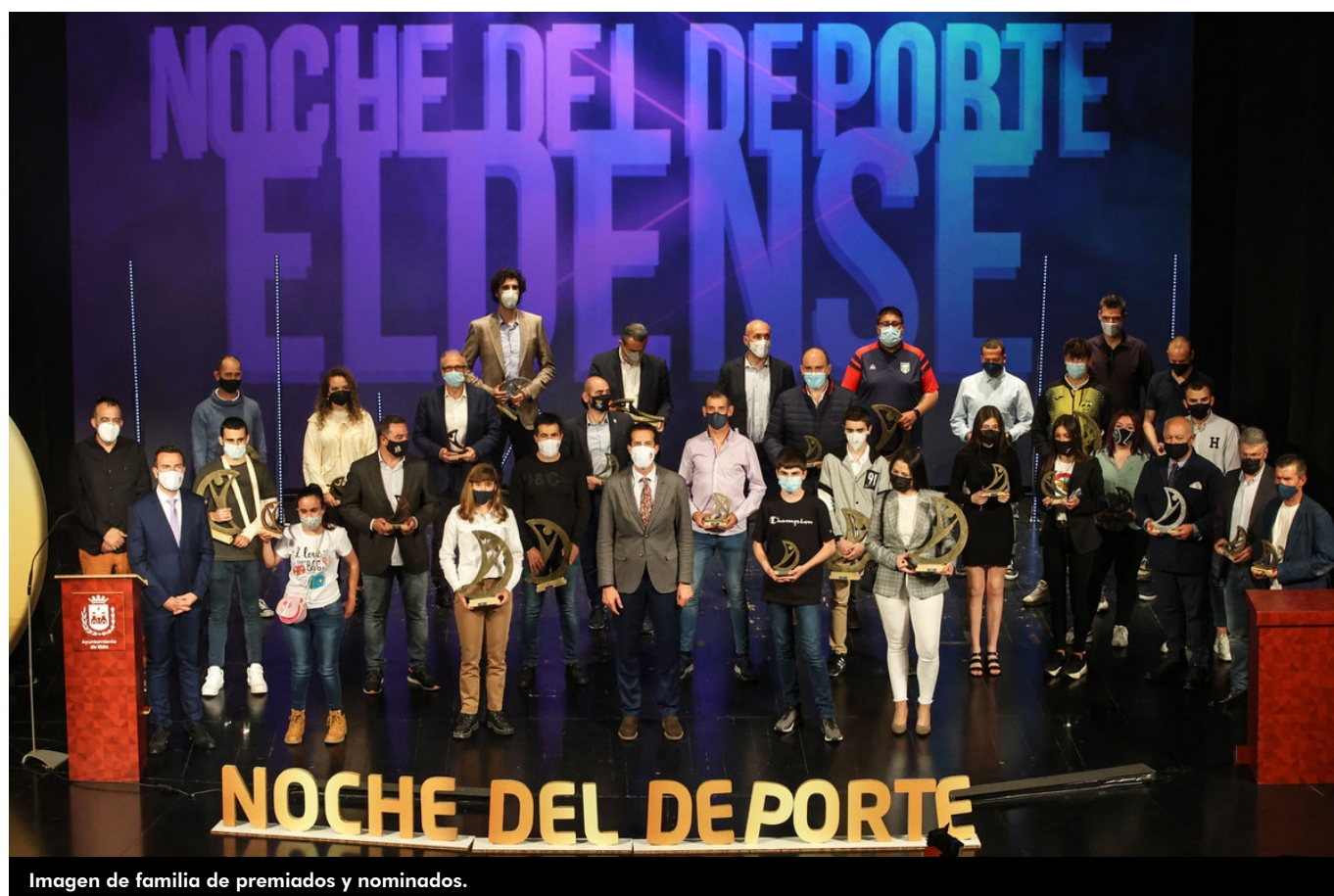
Imagen de familia de premiados y nominados.

El Teatro Castelar se ha vestido de gala para acoger la octava Noche del Deporte Eldense , el día en el que la ciudad premia el esfuerzo y talento de los atletas de Elda por sus logros y éxitos del 2020. Ha sido un acto especial, diferente , que ha reflejado el año de la pandemia, que también ha afectado al deporte.