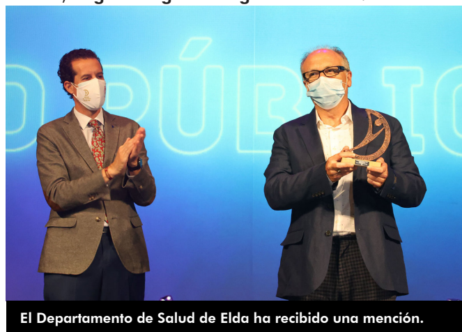
El Departamento de Salud de Elda ha recibido una mención.