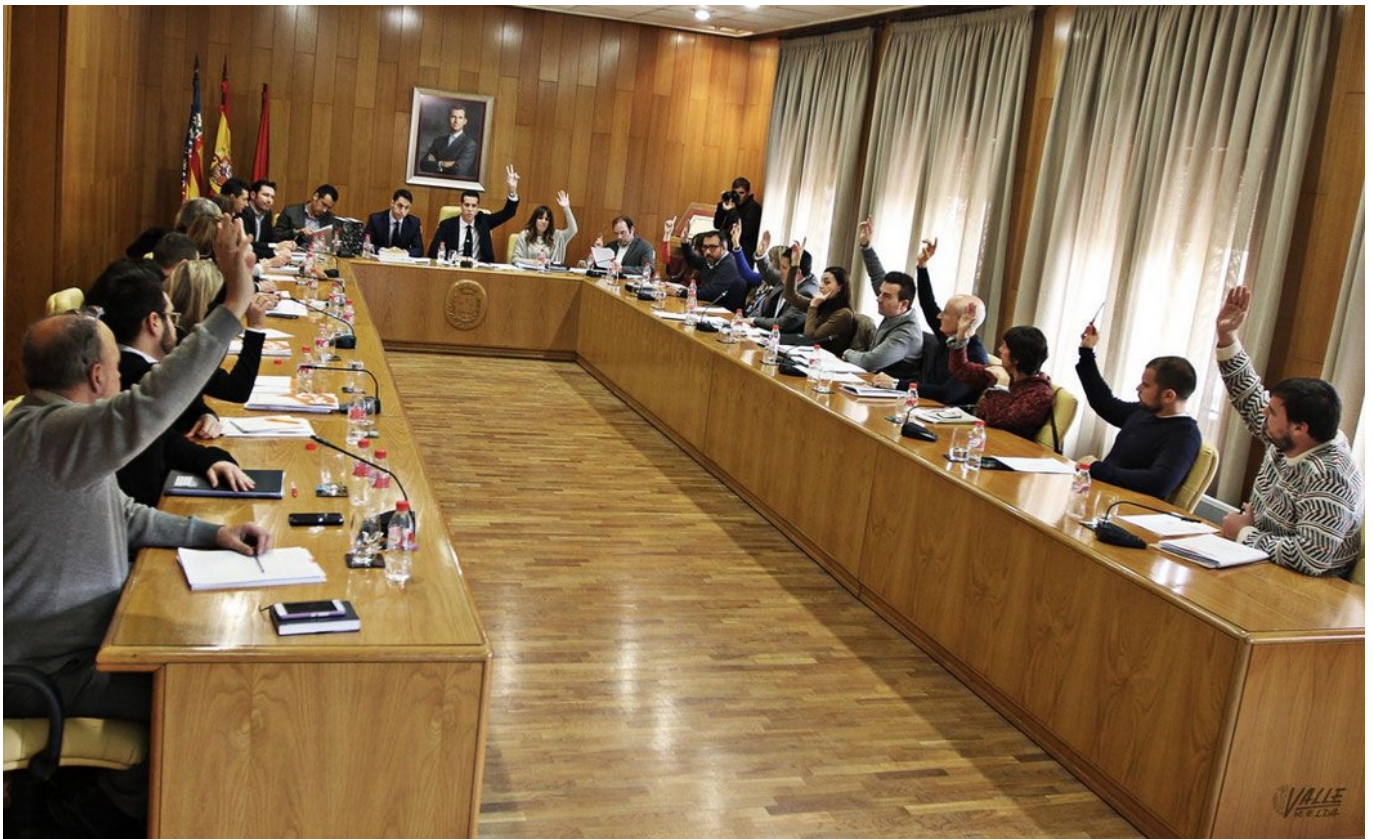
Todos los partidos han votado a favor de los presupuestos salvo el PP, que se ha abstenido | Jesús Cruces.

El Ayuntamiento de Elda ha aprobado por mayoría los nuevos presupuestos municipales en un pleno que ha destacado por el dialogo entre los partidos así como por el voto de confianza que ha dado la oposición al equipo de gobierno . Y es que todos los grupos municipales han votado a favor de los presupuestos a excepción del Partido Popular, que se ha abstenido. Un punto en el que parecían estar de acuerdo todos los partidos de la oposición ha sido "la tardanza" del Partido Socialista y Compromís a la hora de presentar los presupuestos. Esta es la primera vez que se aprueban en Elda unos presupuestos sin ningún voto en contra.