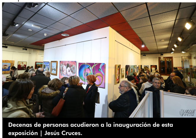
Decenas de personas acudieron a la inauguración de esta exposición