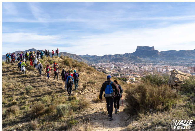
Un centenar de personas ha participado en la Senda de la vuelta a Bolón | Nando Verdú.

Una vez se ha completado la vuelta, gran parte del grupo ha continuado por la Senda de los Reyes Magos hasta alcanzar el Páramo medio , donde se encuentra una de las cuatro mesas geográficas que se han instalado en la montaña, para realizar un almuerzo y dar por finaliza la excursión.