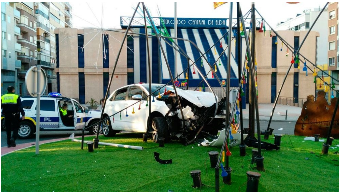
La rotonda ha sufrido daños en su estructura debido al choque.

La rotonda de las Fallas, situada frente al Mercado Central de Elda, ha sufrido desperfectos esta mañana cuando una conductora, pasadas las 8 horas, ha perdido el control de su vehículo y ha chocado contra el monumento en honor a las fiestas del fuego eldenses.