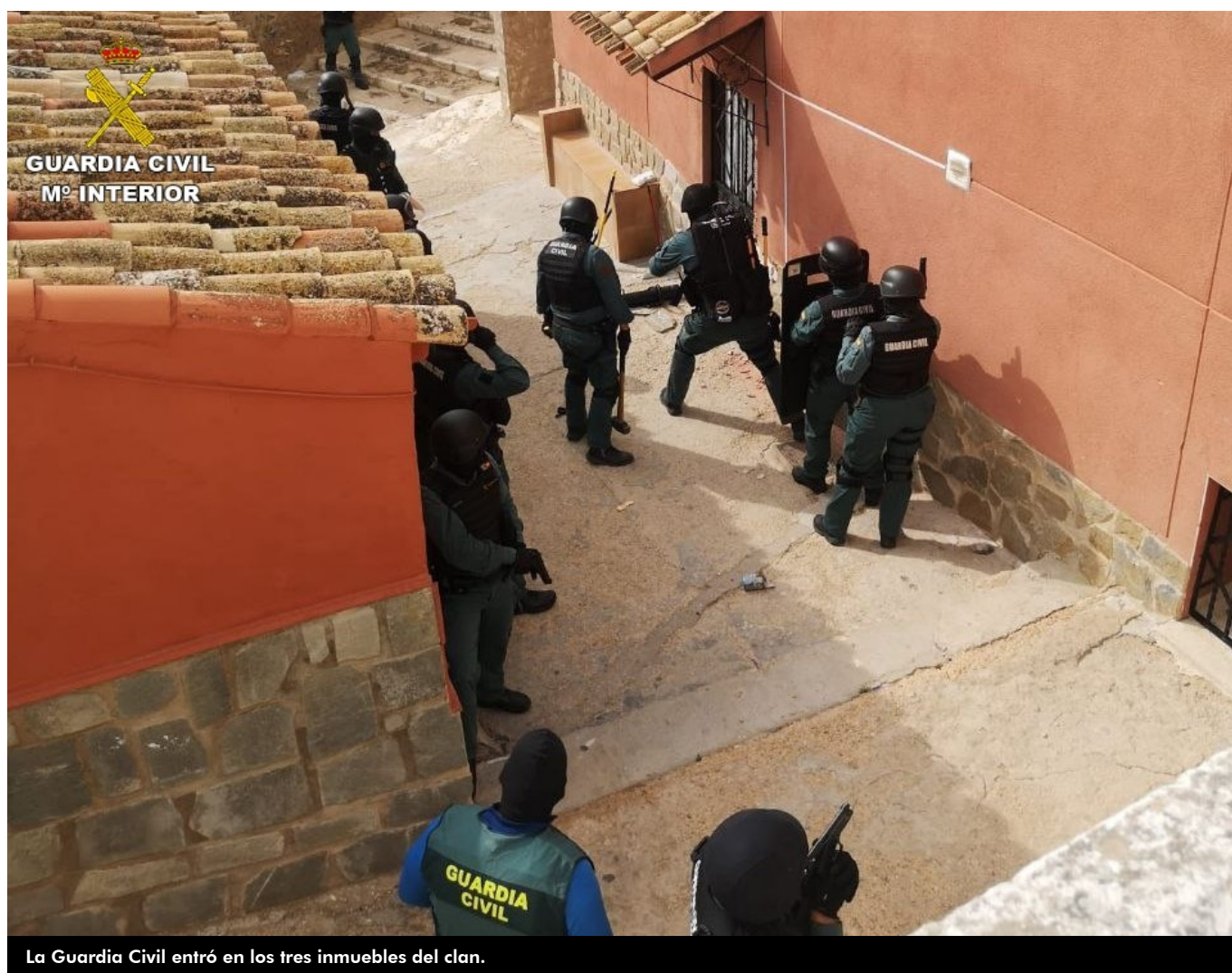
La Guardia Civil entró en los tres inmuebles del clan.

La Guardia Civil desmanteló la semana pasada un clan familiar dedicado al tráfico de drogas entre las localidades de Villena y Petrer, y fueron detenidas nueve personas. El Juzgado de Guardia e Instrucción de Elda ha decretado la prisión de las tres mujeres cabecillas del grupo criminal, mientras que el resto ha quedado en libertad con cargos. También había tres menores de 15 años implicados. La ubicación de la casa está en Petrer, muy cerca del parque de Bomberos. Para la detención se