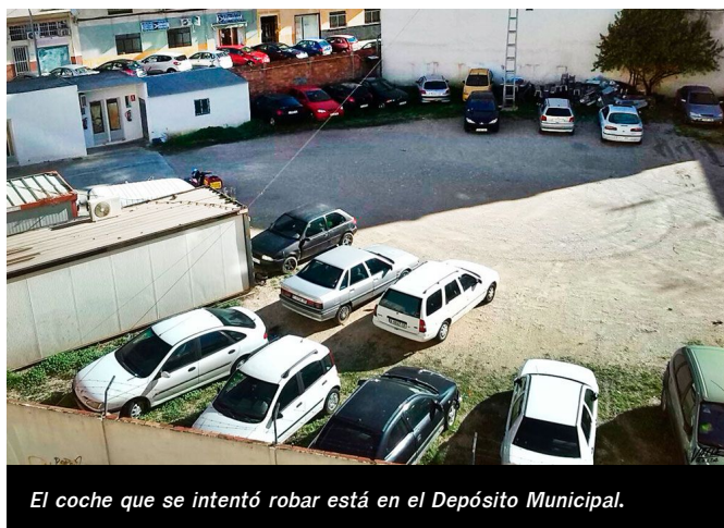
El coche que se intentó robar está en el Depósito Municipal.

Esta banda está formada por jóvenes delincuentes inexpertos que consiguen pequeñas cantidades de dinero pero provocan grandes destrozos en los comercios. Ahora están a disposición del juez.