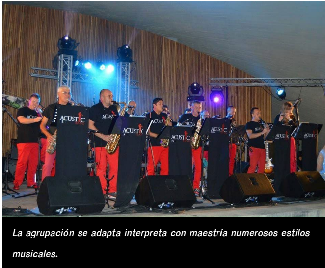
La agrupación se adapta interpreta con maestría numerosos estilos musicales.