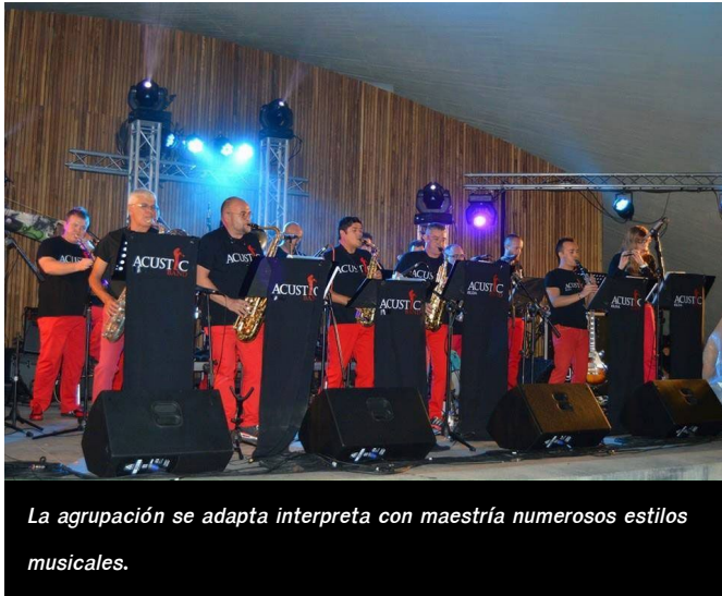
La agrupación se adapta interpreta con maestría numerosos estilos musicales.