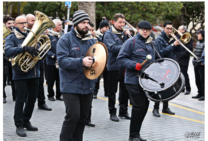
La agrupación participó en el desfile de la Media Fiesta de 2017 | Jesús Cruces.

La banda está compuesta por diecisiete integrantes que cuentan con una dilatada experiencia a lo largo de los años en el género de la música de banda. Han actuado en todo tipo de fiestas, principalmente de Moros y Cristianos, Fallas, Hogueras, fiestas patronales y Semana Santa, así como acontecimientos de índole cultural, festiva y tradicional.