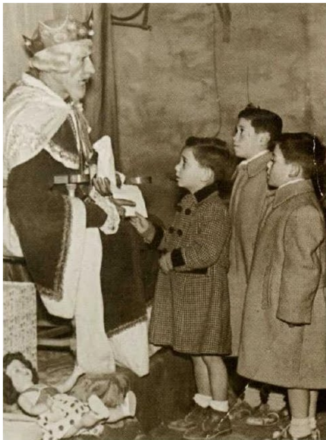
Elda. Años 50. Niños entregando sus cartas al rey Melchor.