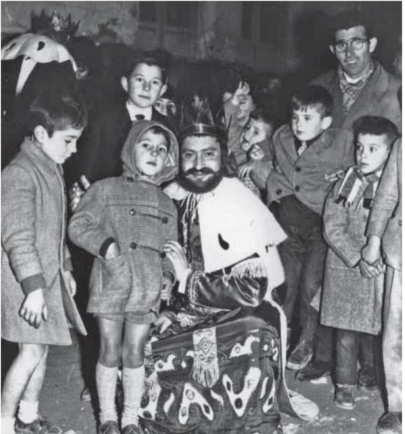
Elda. Enero de 1964. Niños entregando sus cartas al rey Gaspar.