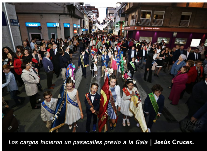
Los cargos hicieron un pasacalles previo a la Gala

Con expectación la gala fue transcurriendo hasta el final, cuando se dio a conocer el nombre del pregonero de las fiestas: el nadador David Meca. El popular deportista desfiló en Elda en 2007 y 2008 con la comparsa mora de los Musulmanes y la cristiana de Piratas. El nadador expresó a través de un vídeo su ilusión por pregonar las fiestas de Elda.