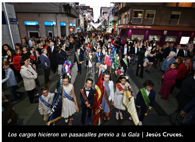
Los cargos hicieron un pasacalles previo a la Gala | Jesús Cruces.

Con expectación la gala fue transcurriendo hasta el final, cuando se dio a conocer el nombre del pregonero de las fiestas: el nadador David Meca. El popular deportista desfiló en Elda en 2007 y 2008 con la comparsa mora de los Musulmanes y la cristiana de Piratas. El nadador expresó a través de un vídeo su ilusión por pregonar las fiestas de Elda.