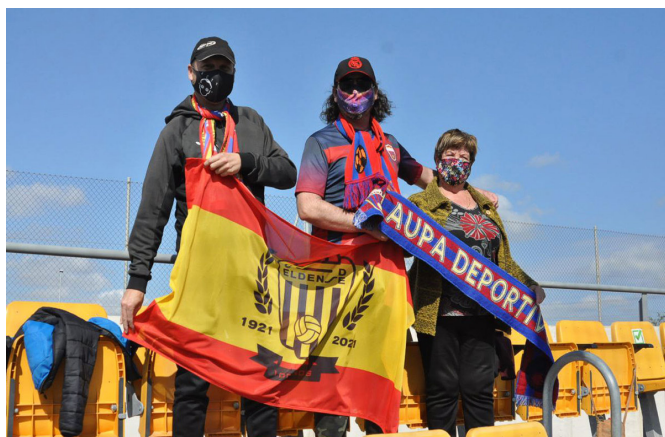
Algunos aficionados han acudido a acompañar al Eldense | Vicen Muñoz.

La derrota del Eldense en el Nuevo Pepico Amat ante el Alzira podría dejarle sin ascenso siempre que el Intercity Sant Joan sume los tres puntos contra el rival que hoy noqueó a un conjunto azulgrana sin pólvora en Villarreal, a pesar de estar arropados por varios seguidores desplazados a tierras castellonenses.