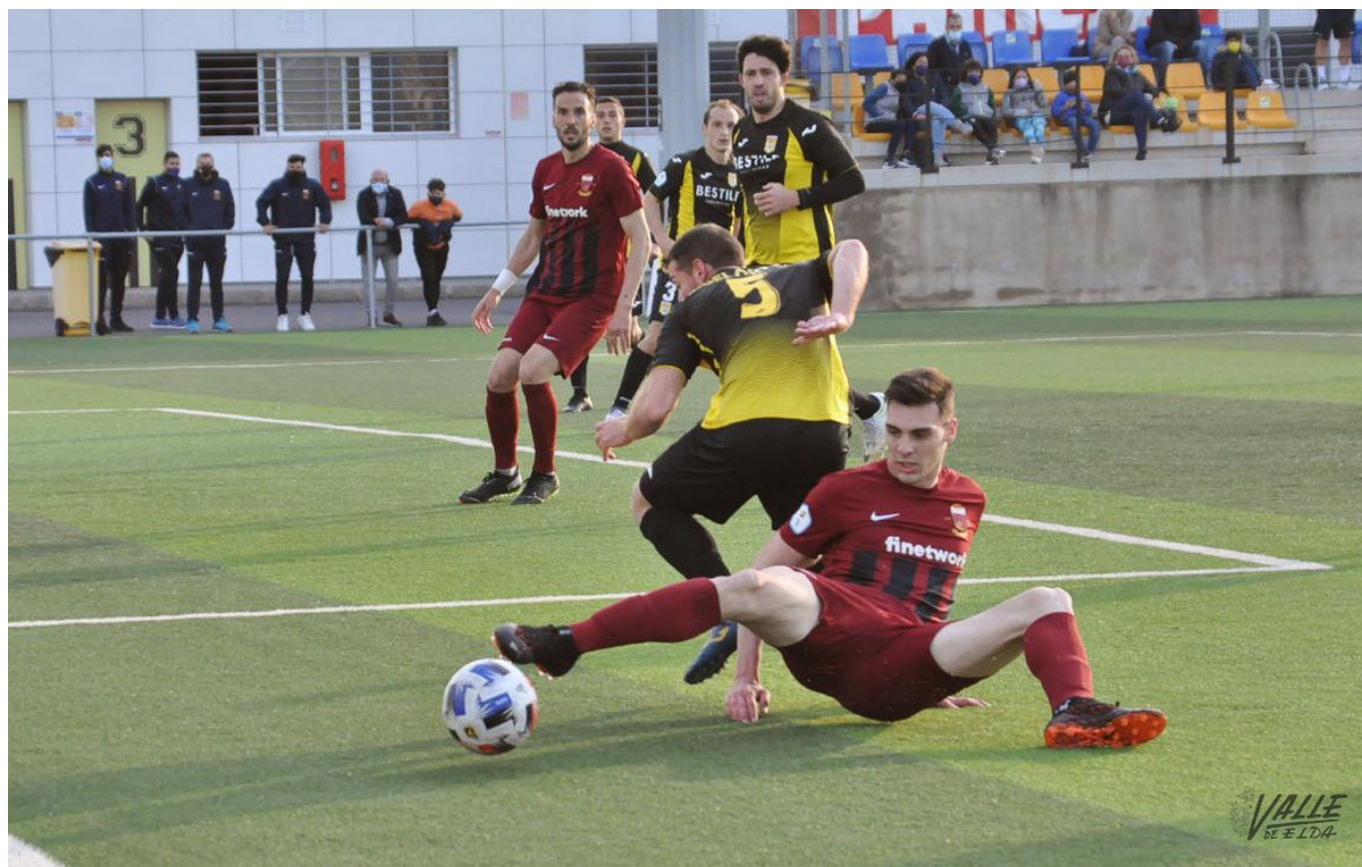
El equipo eldense ha perdido una oportunidad | Vicen Muñoz.

Serio tropiezo del Deportivo Eldense en su intento por ascender a Segunda División B, que la próxima temporada cambiará a Segunda, ya que los de Elda se vieron sorprendidos (2-0) con un tanto en cada periodo por parte del Roda de Villarreal en la penúltima jornada de la fase de ascenso.