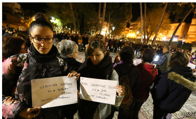
La concentración concluyó con la lectura de las mujeres asesinadas.