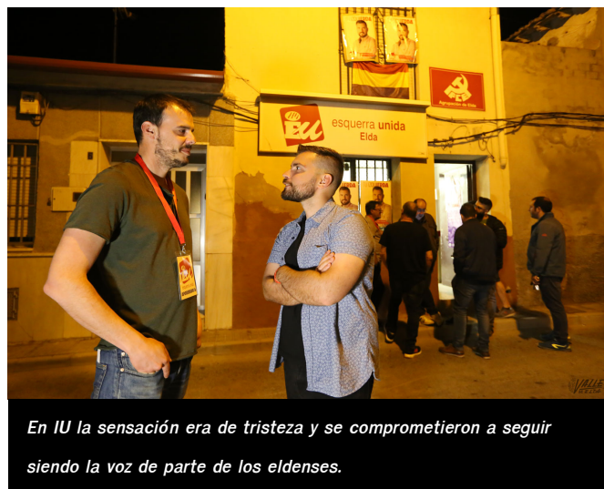
En IU la sensación era de tristeza y se comprometieron a seguir siendo la voz de parte de los eldenses.