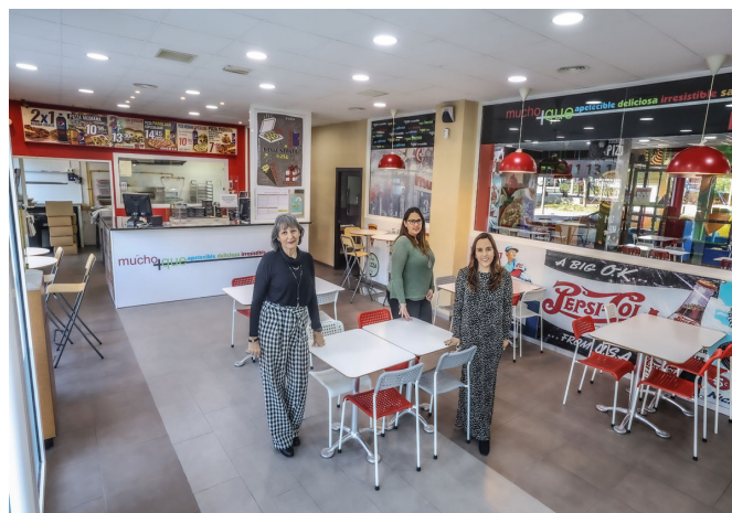
Su oferta estrella es el 3x1 en pizzas medianas y familiares a diario.

Los encargos se pueden hacer en el teléfono 966 111 313. La carta está disponible en su web: www.muchoymasquepizza.com , donde también recogen los pedidos.