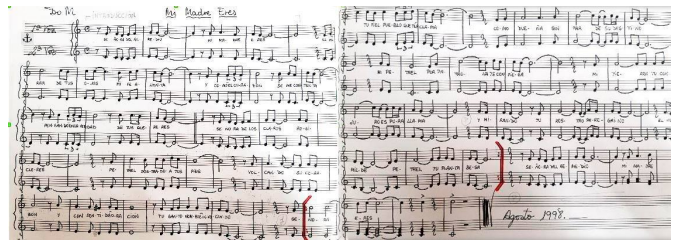
Partitura de "Mi madre eres".