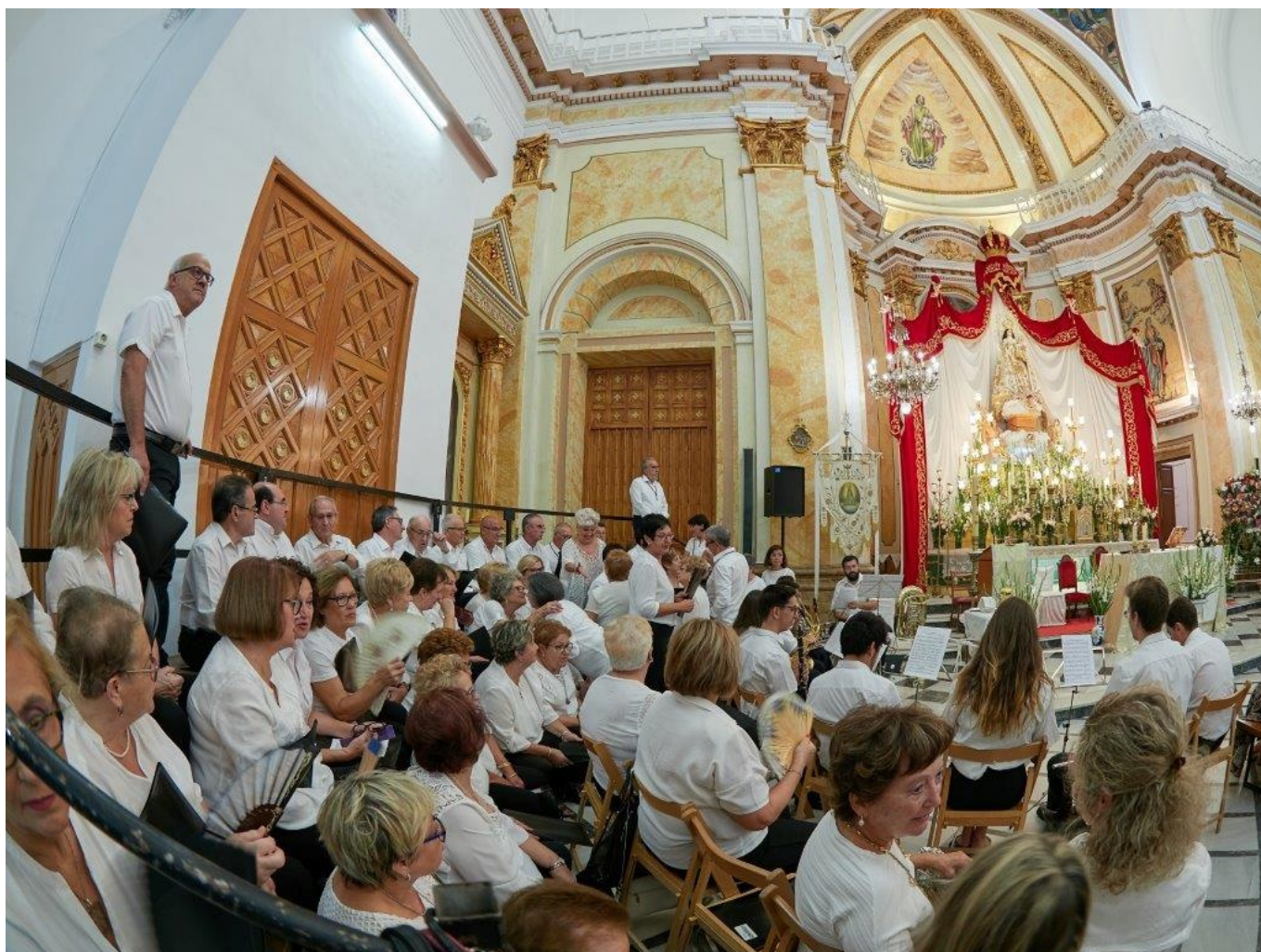
La Coral Petrerense pone voz a los versos del poeta