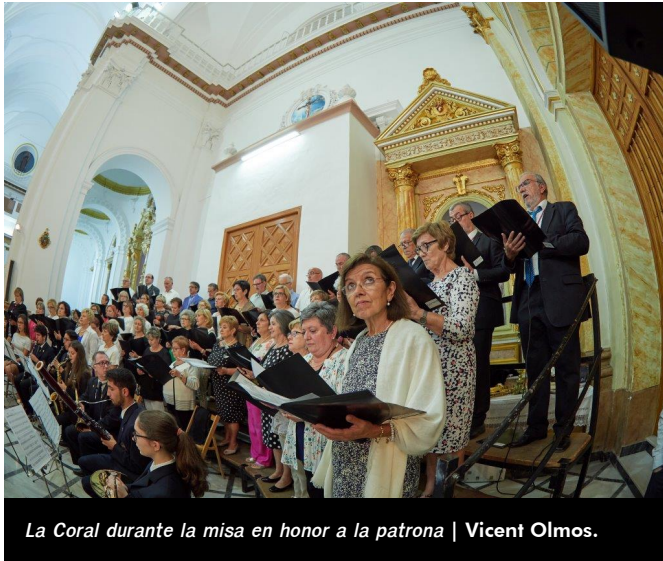
La Coral durante la misa en honor a la patrona

Tormo. Amor y cariño que se ve reflejado en las lágrimas de emoción, cuando al entonar los versos y fundir nuestra mirada con la de Ella mientras desciende, nos hacen sentir a flor de piel, nuestro amor a nuestra patrona y a Petrer.