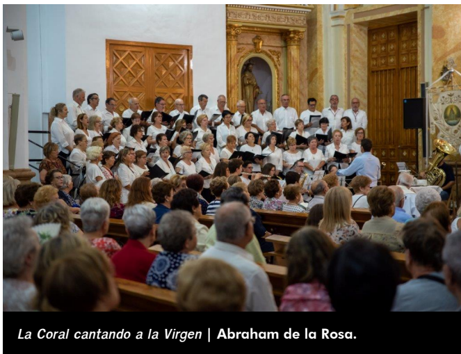
La Coral cantando a la Virgen