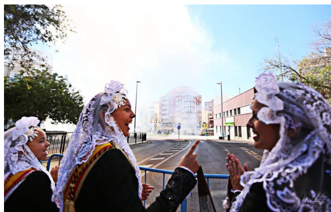
Las Falleras Mayores iniciaron la Mascletá | Jesús Cruces.

Procesión de los patronos de las fiestas del fuego, San Crispín y San Crispiniano.