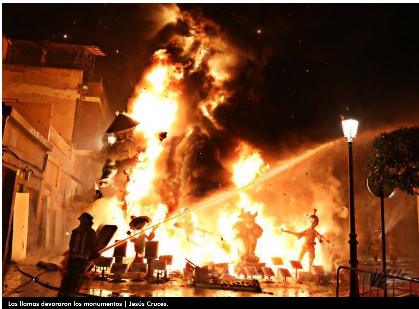
Las llamas devoraron los monumentos | Jesús Cruces.

El fuego purificador y la pólvora fueron los encargados de poner el punto y final durante la cremá a las intensas fiestas de Fallas de Elda. La emoción era palpable entre los falleros que miraban con nostalgia cómo las llamas acababan con cuatro días de fiesta repletos de emociones , y reducía a cenizas los 19 monumentos falleros que desde el pasado jueves llenaban de colorido los distintos barrios. Los falleros vivieron un día completo que contó con la tradicional masclatá desde la rotonda de las Fallas, la Solemne Procesión en honor a los patronos de las Fallas, San Crispín y San Crispiniano, y que finalizó con la cremá.