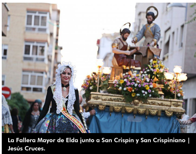
La Fallera Mayor de Elda junto a San Crispín y San Crispiniano | Jesús Cruces.

Los cohetes llenaron de luz y color la ciudad en un espectáculo visual que cada fallero miraba con admiración y cierta tristeza, pero también con alegría, pues significa el nacimiento de un nuevo ciclo. La cremá se celebró sin incidentes gracias a la labor del cuerpo de bomberos de Elda.