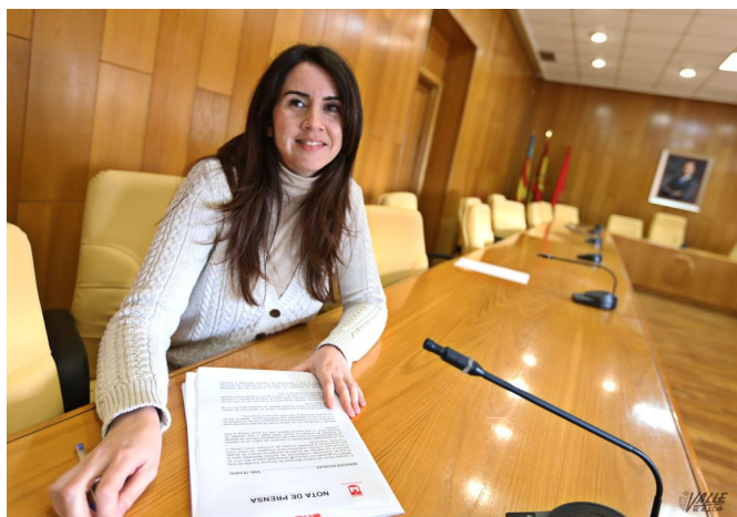
García ha dado a conocer los presupuestos de Servicios Sociales | Jesús Cruces.

Además se incrementa un 10% los convenios con las entidades sociales como Cáritas, Cruz Roja, Amfi, la Asociación de personas sordas de Elda y asociaciones de mayores destinadas a financiar actuaciones y actividades