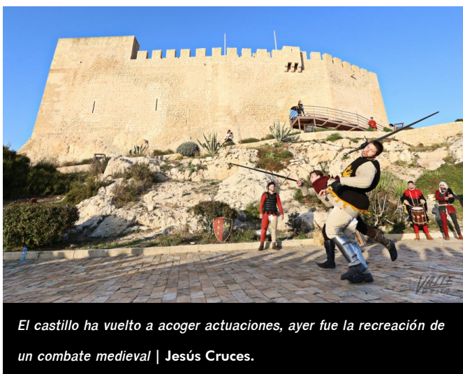
El castillo ha vuelto a acoger actuaciones, ayer fue la recreación de un combate medieval | Jesús Cruces.

Pasear por las calles del casco histórico de la villa se convierte en una tarea complicada durante este fin de semana, pero a la vez en un verdadero lujo , donde cada pocos metros se puede disfrutar de actividades originales y de calidad, con un total de sesenta actuaciones programadas y otras tantas improvisadas. Cada asistente puede elegir entre varias y en el recorrido entre unas a otras es muy difícil no hacer alguna parada para disfrutar de otra píldora de arte . Los artistas, aunque no cobran, pasan la gorra para que el público premie su esfuerzo y talento con propinas. Además, por primera vez los asistentes valoran cada actuación y la que obtenga mayor puntuación ganará el premio del público.