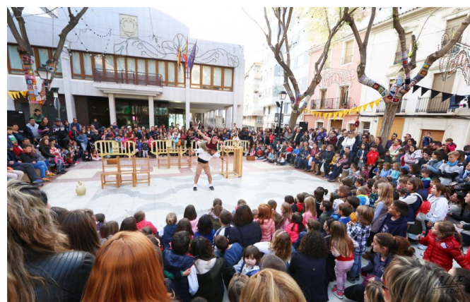
Cientos de personas disfrutan de cada actuación

ArtenBitrir concluye hoy su sexta edición con una intensa jornada en la que numerosos artistas volverán a hacer disfrutar a miles de personas en las calles del casco antiguo. En torno a las 20:45 horas se dará por concluida esta sexta edición del Encuentro de Artistas en la calle. Toda la programación aquí.