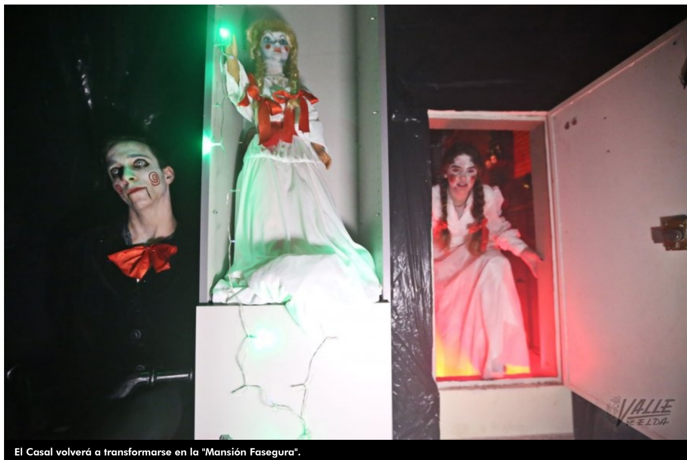
El Casal volverá a transformarse en la "Mansión Fasegura".

El Casal de la Juventud de Petrer volverá a convertirse en la " Mansión Fasegura ", un aterrador pasaje para el disfrute de niños y mayores en la noche más terrorífica del año, el 31 de octubre , Halloween. También habrá un taller de calabazas y, como novedad, un curso de maquillaje de Halloween , actividades que ha organizado la Concejalía de Infancia y Juventud para celebrar la víspera del Día de Todos los Santos. De esta forma la celebración vuelve al Casal, pues el año pasado tuvo lugar en el Castillo .